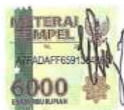
NOVELA NURAINI NINGRUM Nama terang dan standatangan