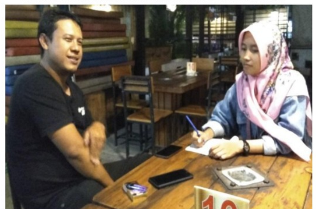
Wawancara dengan salah satu Pemasang Iklan