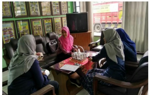
Wawancara bersama staf Radio Perka FM