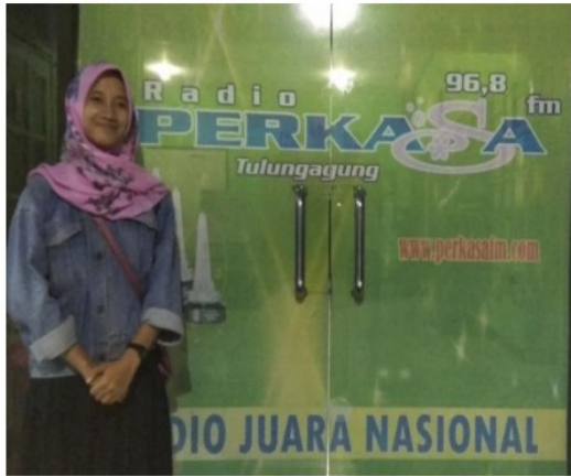
Di depan kantor Radio Perka FM