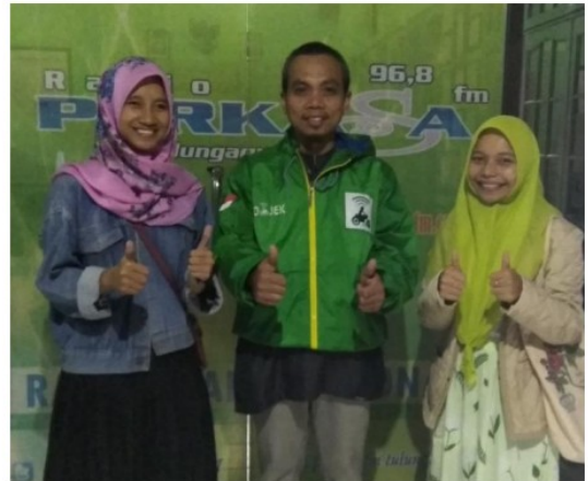
Wawancara bersama Manajer Radio Perka FM