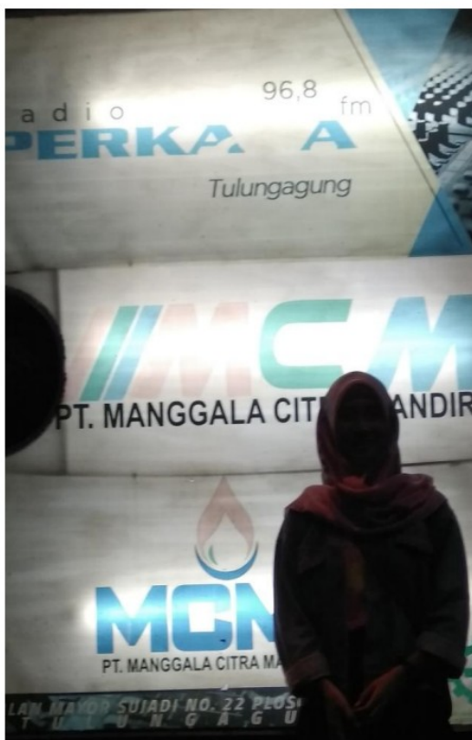
Di depan gerbang Radio Perka FM