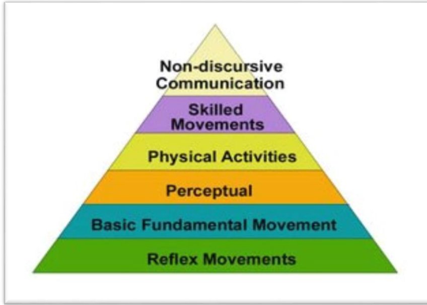
الشكل ٢,٢. منطقة الحركية