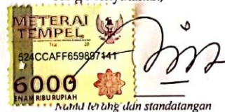
MUHAMMAD ALFIN NUR 'A212

Tulungagung, 5 JULI 2019 Yang Menyatakan,