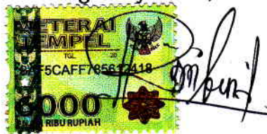
Nama terang dan standatangan ROBIN FULKATIM