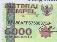
WIDIA ELOK MAULIDINA