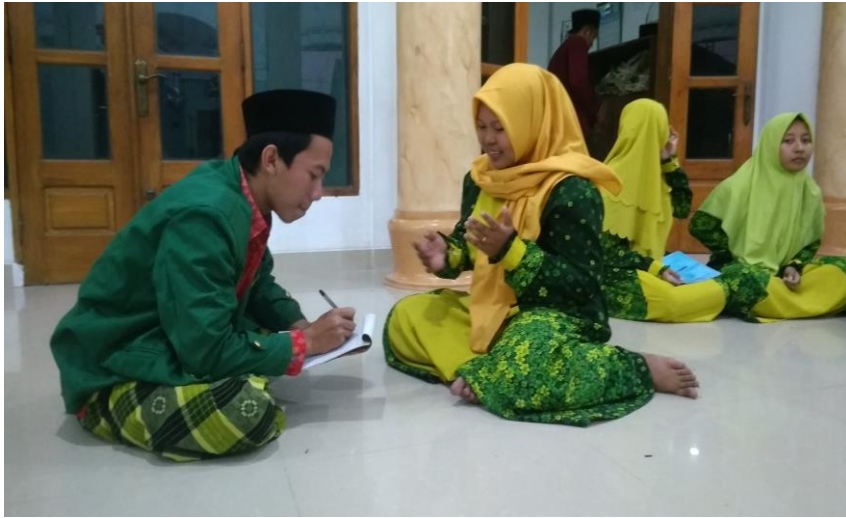
Dokumentasi dengan bu Kalim