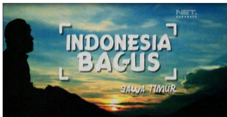
Gambar 3.4 Acara Indonesia Bagus Jawa Timur

Empat acara tersebut merupakan acara yang ditayangkan di NET. Jawa Timur. Dalam membedakan acara lokal dan acara nasional dalam televisi dapat dilihat pada bagian pojok sisi kiri atas televisi ataupun disetiap sudut dari televisi yang mana dalam acara tersebut akan mencantumkan wilayahnya. Seperti gambar dibawah ini.