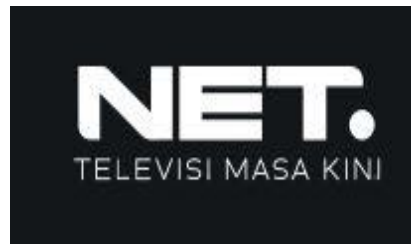
Gambar 3.3 Logo NET.