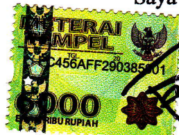
AGENG MEI DIANTO