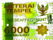
Intan Dwi Viviyanti

Tulungagung, 26 Agustus 2019 Yang Menyatakan,