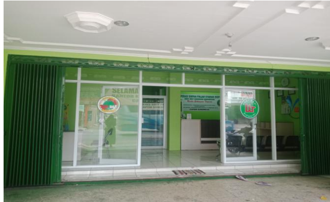
Lokasi penelitian di BMT UGT Sidogiri tampak depan