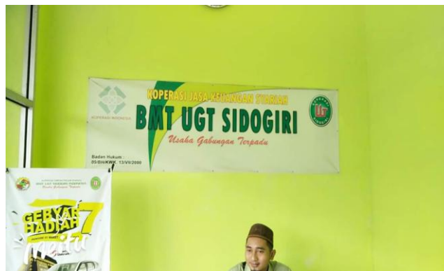
Pengurus BMT UGT Sidogiri Blitar