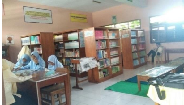
الصورة ٤.١٠ المكتبة ٢٧