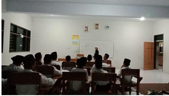
الصورة ٤.٩ تعميق النحوى و الصرف ٢٦