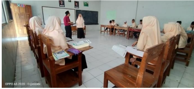
الصورة ٤.٥ الطالبة التي تجد صعوبة في النحوى والصرف ١٩

من بعض المشكلات السابقة، مدعومة أيضًا بتوثيق الباحثة حول الطلاب الذين ما زالوا يعانون من مشكلات في الكلام باللغة العربية وإعطاء التوجيه من المعلمين لتحسين عنها.