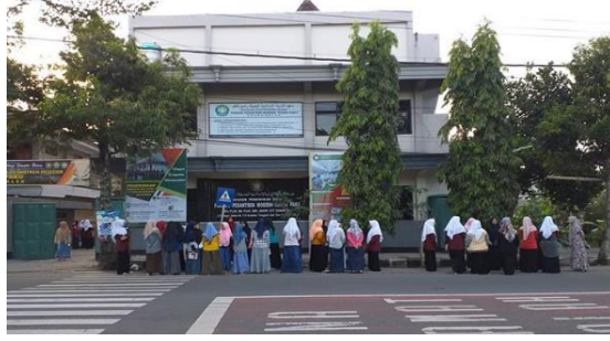
الصورة ٤.٨ المحادثة ٢٥