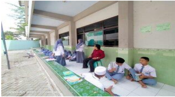
الصورة ٤.٢ عملية تعليم مهارة الكلام اللغة العربية بممارس الحوار في

ويتعلم الغناء باللغة العربية والتشريف. هو حازمًا، لذلك يطبع الطلاب ويستطيع أن يقبل المواد التي سلمها. ١٠ وهذا يتفق مع ما رأت الباحثة عند ملاحظة تعليم مهارة الكلام باللغة العرابية في الفصل العاشر الطبع بالمدرسة الثانوية الإسلامية رادين فاكو ترنجاليك. كان تعليم مهارة الكلام اللغة العرابية خارج الفصل الدراسي يعني أمام المكتب. أنشطة التعليم المنفذة يعني تمارس الحوار لمدة ثم ممارسة المحدثه وفقا للموضوع ولكن بلغتهم الخاصة. وفقًا لملاحظة الباحثة، فإن هذا النشاط يسير بحماس الطلاب، لذلك يرغبون لممارسة الكلام باللغة العربية. ١١ لتعزيز الحقائق السابق، فهو الوثائق البحث عن تعليم مهارة الكلام خارج الفصل الدراسي.