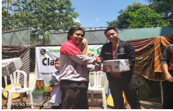
الصورة ٤.١٢ تقديم جوائز مسابقة الخطابة العربية ٣١