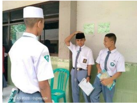
الصورة ٤.٦ الطلاب الذين يجدون صعوبة في الإلتقان المفردات ٢٠