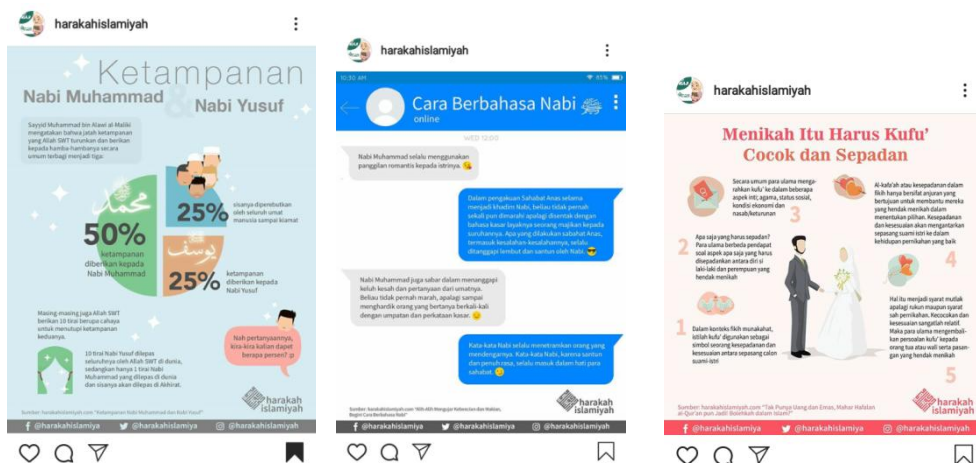
Gambar 3.2 Daftar Gambar @harakahislamiyah periode bulan Desember 2019

Berikut ini gambar-gambar pesan dakwah @harakahislamiyah periode bulan desember 2019 yang menjadi objek penelitian yaitu :