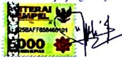
Harir Aida Fitria