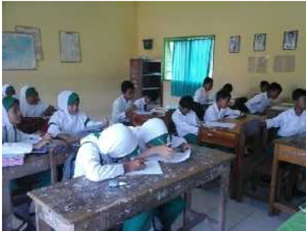
Peserta didik mengerjakan pre tes.