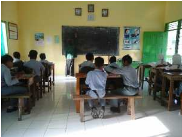
Peneliti menerangkan materi tentang Keputusan Bersama.