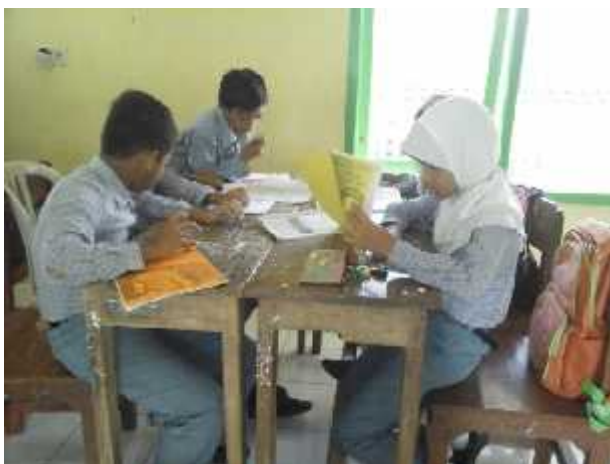
Peserta didik belajar bersama anggota kelompok.