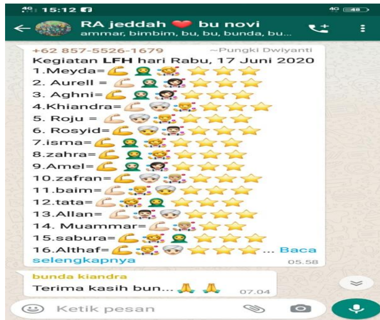
Gambar 4.4 list anak yang sudah mengerjakan tugas 79

Dalam hal ini pula bu Efa selaku orang tua dari Syahda Nabila Aluna menjelaskan: