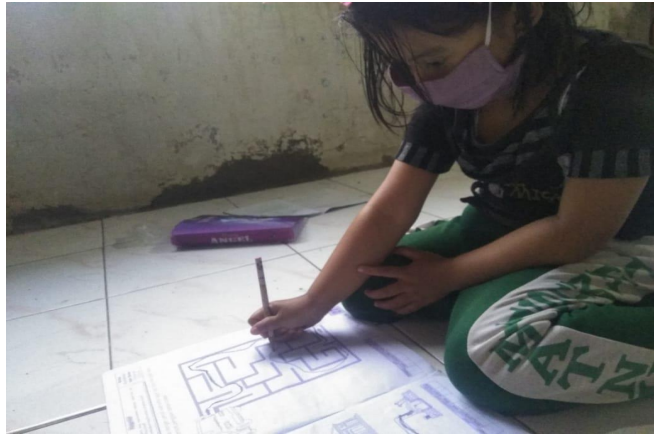
Gambar 4.5 bentuk tugas mengerjakan LKA 81

pemerintah untuk menonton Telivisi (Tv) dari TVRI itu anak juga harus menonton dengan dampingan orang tua juga 80