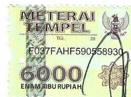
Elma Dwi Puspita