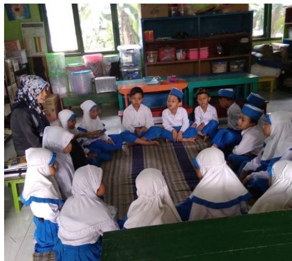
Gambar 3.4 kegiatan awal.

Kegiatan awal dalam pelaksanaan pembelajaran yaitu terlebih dahulu pendidik menyampaikan kepada anak tentang kegiatan pembelajaran hari ini, bertujuan untuk mengajak anak agar mengikuti pembelajaran dari awal sampai akhir. Sebagaimana yang didapati Ketika observasi dimana guru mengajak anak untuk membangun hubungan dengan orang yang ada disekitarnya dengan cara mengajar anak untuk melihat kira-kira teman satu kelompoknya apakah ada yang tidak hadir serta mendengarkan nanti Ketika berganti kegiatan Ketika sudah menyelesaikan tugas di kegiatan kelompok yang sedang di tempati namun tetap dengan kelompok yang sama yang berarti anak harus mau menunggu teman yang belum selesai. 99 adapun keterangan diatas di dukung dokumentasi 100