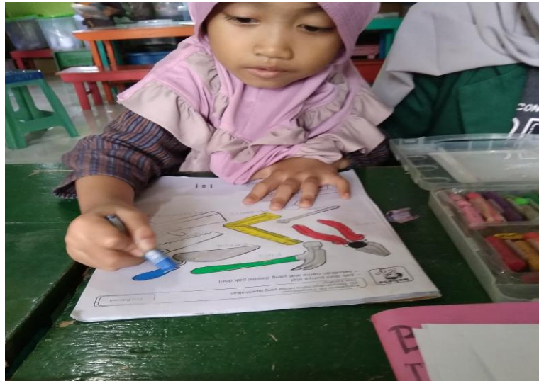
Gambar 3.5 anak dapat membaca gambar.

warnai Bernama cetok kemudian temannya juga mengatakan jika dia sedang mewarnai gergaji. 101 Didukung dengan dokumentasi. 102