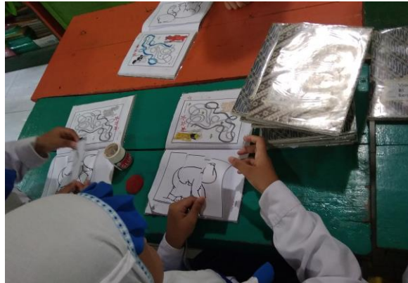
Gambar 3.3 media gambar dalam mengarahkan perhatian anak.

Pada gambar 3.3 didapati kegiatan anak saat pembelajaran berlangsung dalam mengarahkan perhatian anak tentang profesi petani guru menggunakan media gambar yang berupa puzzle untuk anak tempel kedalam buku kemudian diberi warna yang sudah disediakan oleh guru.