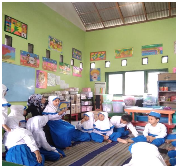
Gambar 3.1 penggunaan media gambar saat proses pembelajaran. 91

Penjelasan diatas menjelaskan bahwa di TK Mardi Sunu Tanjungsari Boyolangu salah satu media pembelajaran yang digunakan saat proses pembelajaran adalah media gambar. pernyataan tersebut di dukung oleh dokumentasi yang menunjukkan penggunaan salah satu media gambar untuk keterampilan membaca.