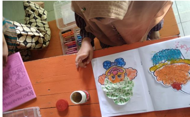
Gambar 3.6 kegiatan kholase dengan kertas kue

Pada gambar 3.6 diatas menerangkan kegiatan anak Ketika sedang mewarnai gambar profesi pada sub bab badut, disini anak diminta untuk mewarnai dan menempelkan kertas kue.