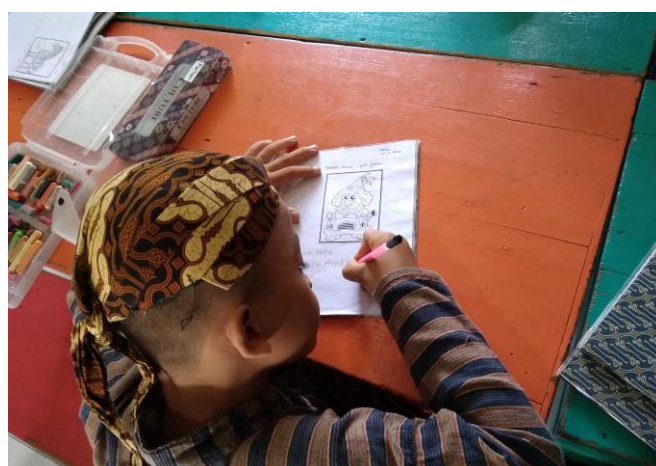
Gambar 3.7 media gambar dalam keterampilan menulis

Kegiatan pada kelompok 3 saat observasi di dapati guru memberikan kegiatan dengan meminta anak untuk menuliskan apa yang anak ketahui terkait dengan gambar yang terdapat di atas buku. 105 Didukung dengan adanya dokumentasi Ketika kegiatan berlangsung. 106