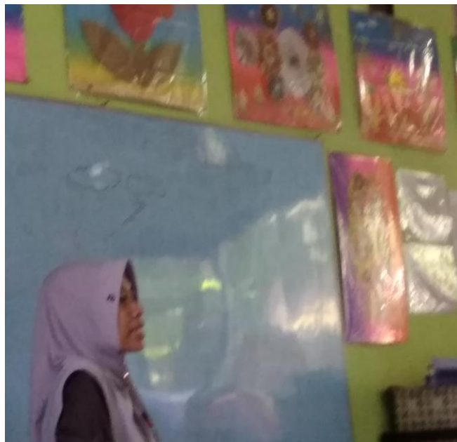
Gambar 3.9 penggunaan media gambar yang di aplikasikan di papan tulis.

Setelah kegiatan selesai dan kemudian berdoa sebelum pulang serta bertanya kepada anak hari ini kegiatan pembelajarannya apa saja, kemudian guru juga mengajak anak untuk melakukan tebak-tebakan dengan membuat gambar di papan tulis saat itu gambar yang di buat guru adalah gambar awan, hujan dan petir kemudian guru menjelaskan kepada anak tentang pertanyaan nya apa saja tanda ketika akan turun hujan. 109 Terdapat dokumentasi sebagai pendukung dari kegiatan. 110