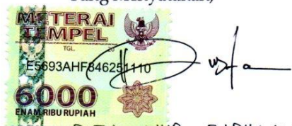
DITA NUR FADILLAH Namaterangdantandatangan

Tulungagung, 25 Januari 2021 Yang Menyatakan,