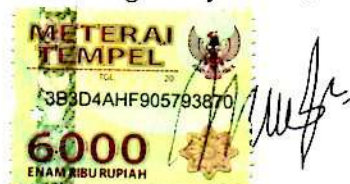
MULYA WIDYA NINGRUM Namaterangdantandatangani

Tulungagung, 03 Februari 2021 Yang Menyatakan,