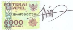
Acmad Risky Solaiman