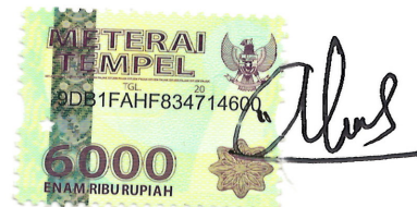
YULINDA EKA AFIRIA