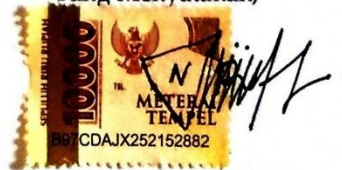
Novita Wakhidatur Rizqi Namaterangdantandatangan