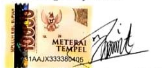
MIFTAHUL AINI TOHAROH Namateranglantandatangan

Tulungagung, 03 Agustus 2021 Yang Menyatakan,