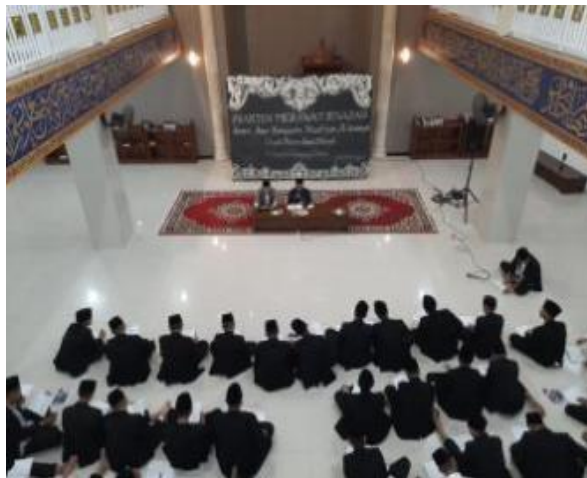
Gambar 4.7 Pelaksanaan Ujian Semester Genap Madrasah

Tsanawiyah Darul Hikmah Tawang Sari Tulungagung. 34