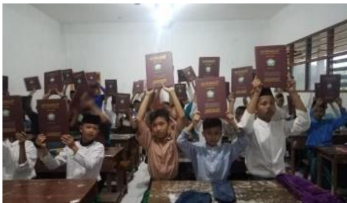
Gambar 4.8 Pembagian Raport Semester Genap Madrasah Tsanawiyah Darul Hikmah Tawang Sari Tulungagung. 38

pengukuran seperti yang sudah dijelaskan dan setiap jenjang baik kls 7, 8, 9 ada pengukurannya masing-masing dan untuk hasilnya nanti diadakan dengan pembagian raport. 37