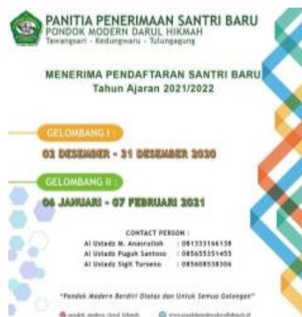
Gambar 4.1 Dokumentasi Brosur Pendaftaran Santri Baru Madrasah Tsanawiyah Darul Hikmah Tawangarsari Tulungagung 5

Jadi dapat penulis simpulkan baik dari pernyataan dari waka kesiswaan dan waka kurikulum bahwa dalam sistem pembentukan kepanitiaan penerimaan peserta didik baru madrasah hanya sebagai penghubung dari pondok pesantren mengenai administrasi karena dalam perencanaan penerimaan peserta didik, pondok pesantren yang menentukan pembentukan kepanitiaan tersebut. Kemudian terdapat tahap dan dalam penerimaan peserta didik yang dilakukan pada sekolah itu sendiri, mengenai prosedur penerimaan dan tahap awal promosi biasanya dilakukan melalui kunjungan di sekolah, melalui penyebaran brosur dan sosial media.