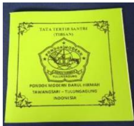
Gambar 4.5 Dokumentasi Buku Tata Tertib Santri (TIBSAN)

Untuk pembinaan kedisiplinan siswa kesiswaan juga bekerjasama dengan pengasuhan pondok jadi mungkin pada saat anak itu ada melanggar aturan maka yang menindak terlebih dahulu adalah pengasuhan, dan pada saat anak itu sudah tidak bisa ditoleransi maka pengasuhan memberikan surat rekomendasi kepada kepala sekolah dan diteruskan kepada kita kesiswaan untuk ditindak lanjuti. Memang kita sistemnya di madrasah ini pelajaran pondok paling utama, jadi ada untuk menyeleksi semuanya memang kita masih menggunakan kenaikan kelas jadi untuk anak yang sudah tidak bisa di toleransi lagi dia harus tidak naik kelas. 21