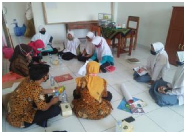
Gambar 4.9 Dokumentasi Musyawarah Satu Bulan Sekali Awal Bulan di Hari Kamis Minggu Pertama 40

Waktu pelaksanaan evaluasi diadakan setiap bulan sebenarnya kita sudah mengevaluasi apa saja yang sudah direncanakan, makannya kenapa kita setiap bulan kumpul baik staff maupun waka-waka yang lain supaya tau apa permasalahannya misalkan bulan kemarin ada yang belum terlaksana dan bagaimana bulan ini terlaksana atau tidak. Kita memang prinsipnya kalau dari pondok ini mudah keluar tapi susah masuk maksudnya mutasi dari luar kita tidak menerima tapi bagi mereka yang ingin mutasi keluar itu mudah karena berkaitan dengan pelajaran pondok kecuali yang bermutasi yang beraviliasi dari kita pondok modern kayak anak gontor karena secara pembelajaran pondoknya masih sama. 39