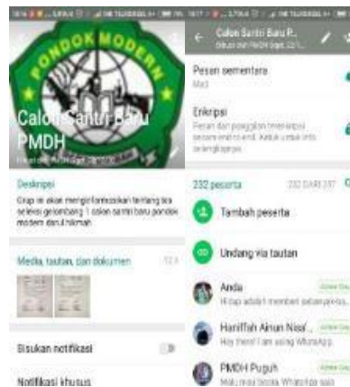
Gambar 4.2 Dokumentasi Grub Whatsapp Calon Santri atau Peserta Didik Baru Madrasah Tsanawiyah Darul Hikmah Tawangsari Tulungagung 10