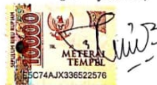
Nurul Elvonny Sintha Namaterangdantatangan