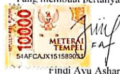
Findi Ayu Ashari