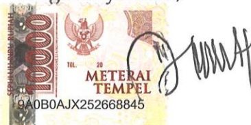
FIRDA TRIA DEVI Namaterangdantandatangan