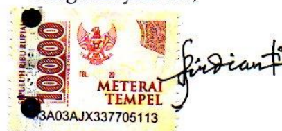
Fifi Firdianti Namaterangdantandatangani

Tulungagung, 25 Agustus 2021 Yang Menyatakan,