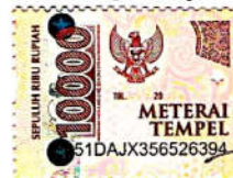
Fatimah Nisyapuri Namaterangdatandatangani

Tulungagung, 25 Agustus 2021 Yang Menyatakan,