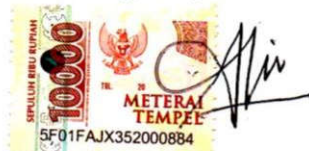
KHOIRUN NISAK AGUSTIKA Namaterangantandatangan

Tulungagung, 01 SEPTEMBER 2021 Yang Menyatakan,