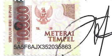
Dian Nur Islami