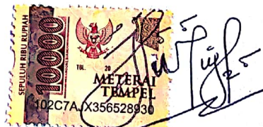
LATIFATUL MAGHFIRAH Namaterangdantandatangan

Tulungagung, 01 - 09 - 2021 Yang Menyatakan,