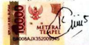
Titik Kholipah Namaterangdantandatangan

Tulungagung, 8 September 2021 Yang Menyatakan,