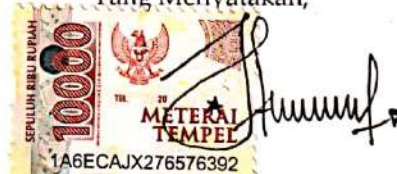
ARUM NUR INDASAH Namaterangdantandatangani

Tulungagung, 07 September 2021 Yang Menyatakan,