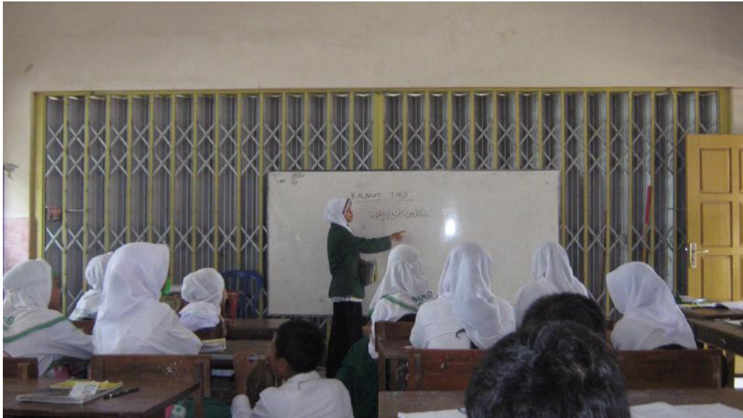
Siswa membaca kalimat tayibah 2 yang ditulis guru secara bersama-sama