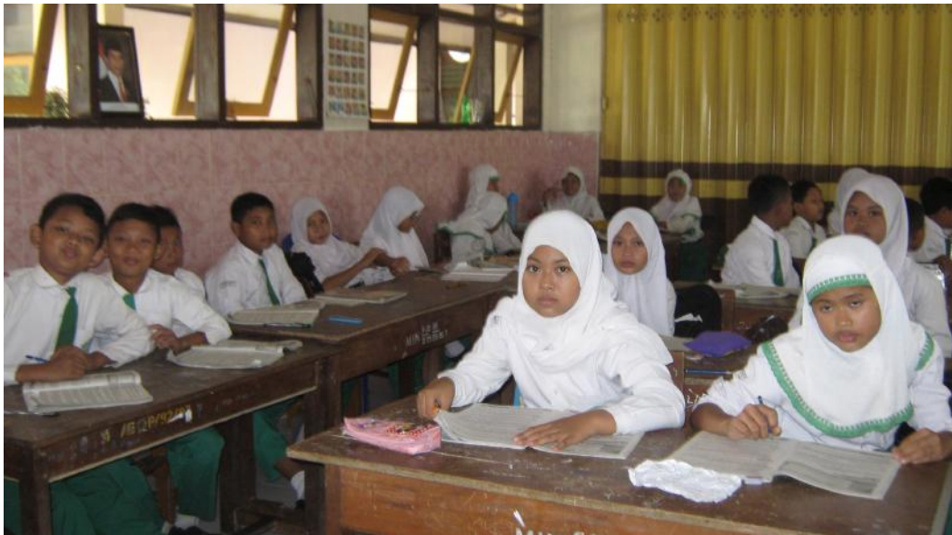
Siswa memperhatikan materi kalimat tayibah 2 yang disampaikan oleh guru