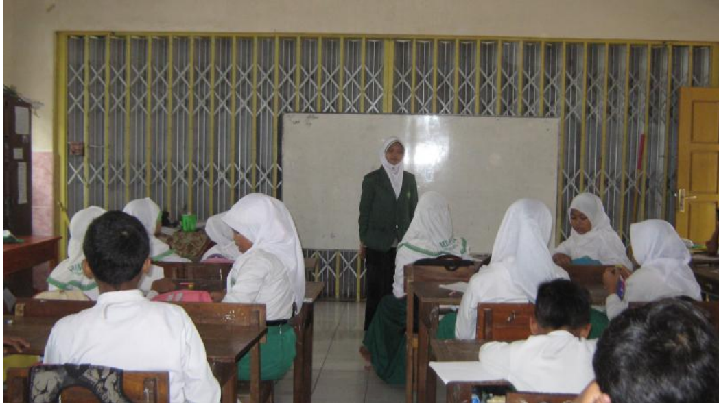
Siswa kelas V menyiapkan buku mata pelajaran Aqidah akhlak