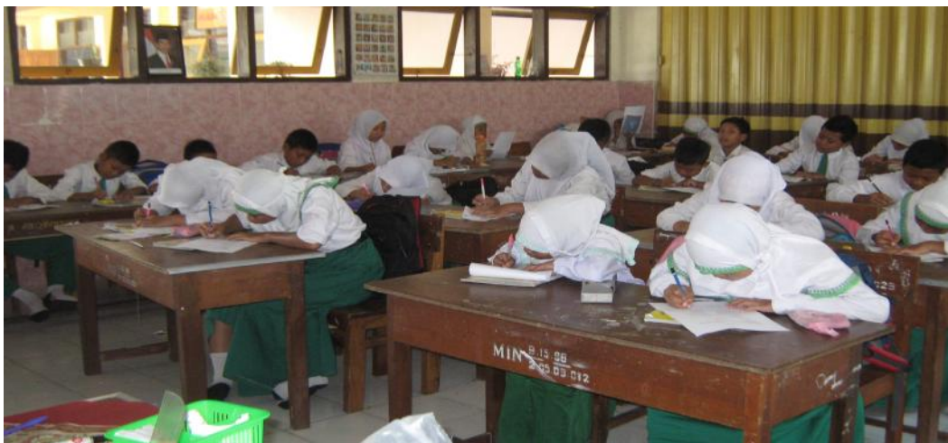
Siswa mengerjakan lembar post test yang diberikan oleh guru dengan sungguh-sungguh