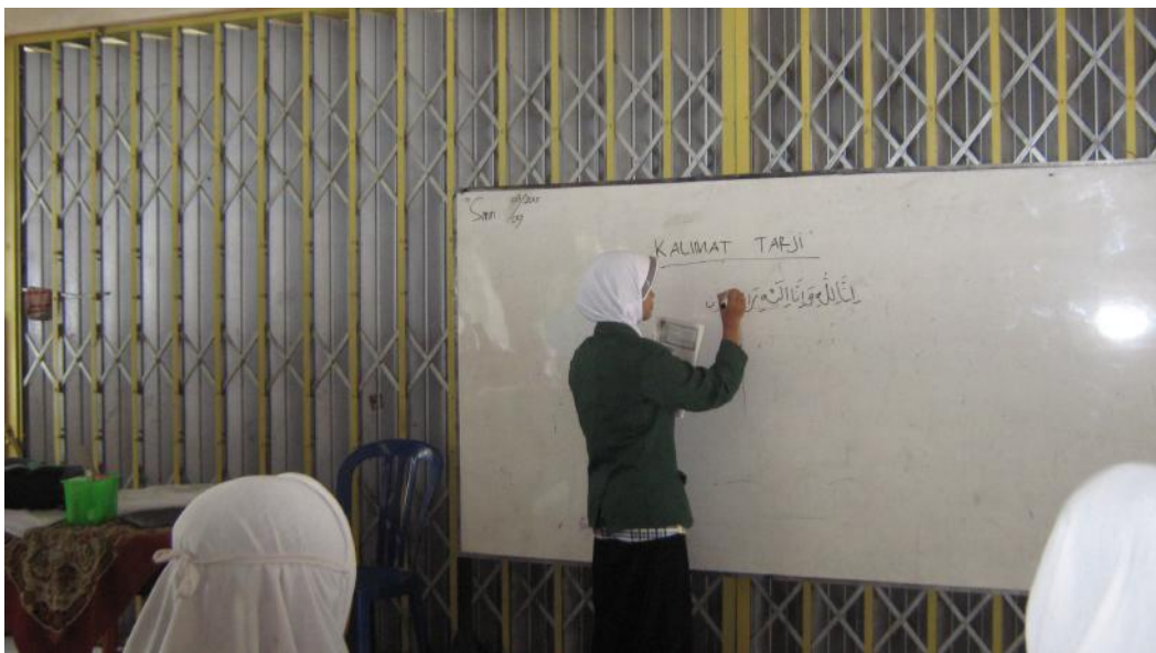
Guru menulis materi kalimat tayibah 2 di papan tulis, dan siswa memperhatikannya.