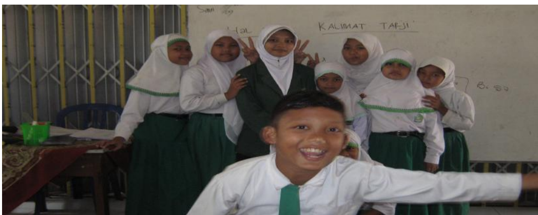
Guru dan siswa foto bersama setelah proses pembelajaran selesai