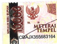
Tria Mailana Defi

Tulungagung, 13 September 2021 Yang Menyatakan,