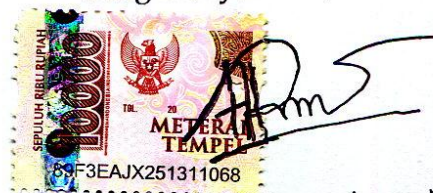
Nur Arsyadan Assabil Namaterangdantandatangan

Tulungagung, 17 Juni 2021 Yang Menyatakan,