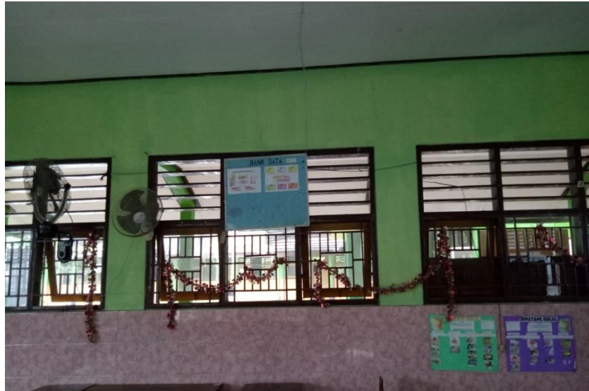
Gambar 4.3 Dokumentasi ruang kelas 5 di MIN 4 Tulungagung 18

Gambar di atas membuktikan bahwa ruang kelas di MIN 4 Tulungagung didesain semenarik mungkin untuk menumbuhkan minat dan semangat siswa dalam belajar dikelas. Ruang kelas merupakan proses terjadinya pembelajaran. Desain ruang kelas yang menarik serta kondisi kelas yang bersih akan membuat suasana ruang kelas terlihat indah serta nyaman digunakan dalam proses pembelajaran. Hal ini diperkuat dengan apa yang disampaikan oleh Ibu Choirunikmah, S.Pd.I. beliau mengatakan bahwa: