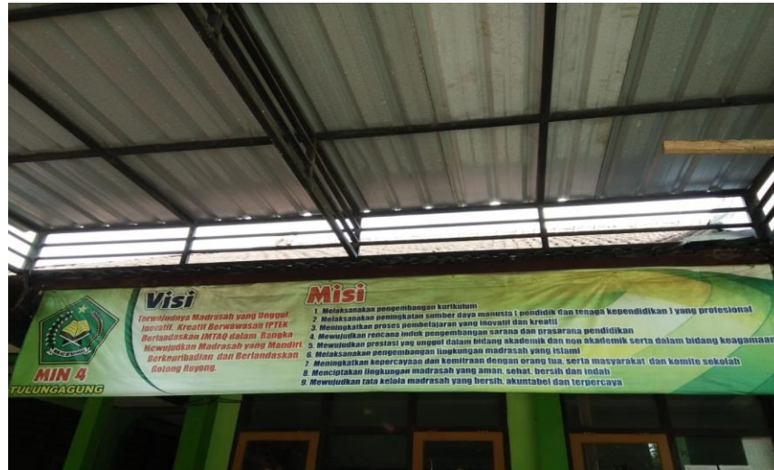
Gambar 4.6 Visi Misi MIN 4 Tulungagung 29

kualitas dalam pengajaran dikelas, dan menguasai keterampilan-keterampilan menjadi seorang guru. 28