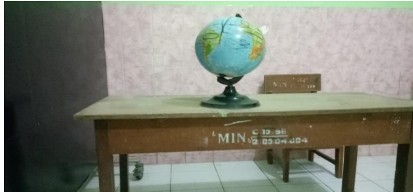
Gambar 4.2 Dokumentasi fasilitas alat peraga edukatif dari madrasah 12

Dari dokumentasi di atas dapat membuktikan bahwa terdapat fasilitas alat peraga edukatif yang telah disediakan oleh madrasah untuk menunjang proses pembelajaran. Alat peraga edukatif berpengaruh sekali terhadap proses pembelajaran. Proses pembelajaran yang tidak menggunakan alat peraga edukatif akan membuat siswa kurang tertarik dan kurang semangat dalam belajar, materi yang diajarkan guru juga kurang bisa diserap oleh siswa. Hal ini sesuai dengan pendapat yang disampaikan oleh Ibu Choirunikmah, S.Pd.I. Bahwa: