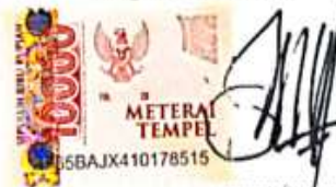
LUIZ INKA PRASASTI Namaterangdantaulangan

Tulungagung, 30 Oktober 2021 Yang Menyatakan,