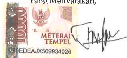
Rofiatus Salma Namateranglantandatangani

Tulungagung, 20 November 2021 Yang Menvatakan,