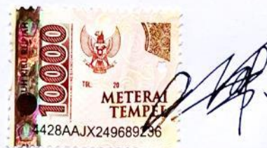
Nila Qurotul Ayun