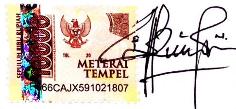
Faricha Lita Nabbila Namaterangdantatangan

Tulungagung, 13 Desember 2021 Yang Menyatakan,