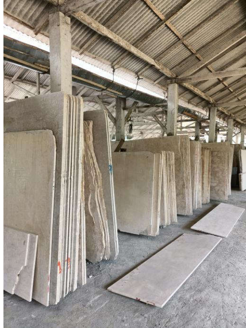
Gambar 4.4 Bahan Baku

Harga memang membawa baik buruknya kualitas dan menjadi suatu kekuatan untuk memperoleh keuntungan dalam perusahaan. Dalam penjualan marmer jarang sekali untuk mengadakan diskon itupun dikarenakan dengan berbagai proses untuk menjadikan marmer sebagai barang yang berkualitas akan seimbang dengan harga yang tidak murah. Pemotongan harga hanya dilakukan untuk pengambalian barang atau kapaitas yang banyak. Hal ini untuk menjaga konsumen agar tetap menjadi pelanggan yang tetap. Jadi pelanggan sangat berpengaruh penting terhadap perusahaan dari produksinya hingga pemasaran. Dengan banyaknya pelanggan akan banyak pula pendapatan yang diterimanya.