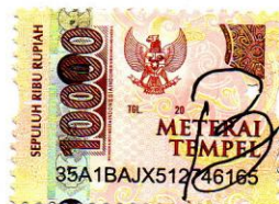
BINTI LAILATUN NADIROH Namaterangdantandatangan

Tulungagung, 10 Januari 2022 Yang Menyatakan,