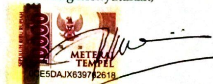
IVE PRESELIA AGUSTINA Namaterangdantandatangani