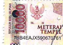
NORISWANA AYNAYA AL AZIZAH