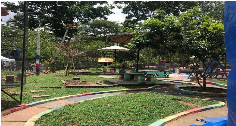
Gambar 4.6 Kondisi Kampung Susu Dynasty sepi di masa pandemi Covid-19. 116

Penurunan penjualan produk yang dialami oleh Kampung Susu Dynasty merupakan sebuah hal yang wajar terjadi pada bidang bisnis akibat adanya pandemi Covid-19 ini. Sehingga dengan adanya penurunan pembelian maka hal ini memberikan dampak secara langsung kepada pendapatan yang diperoleh oleh Kampung Susu Dynasty.