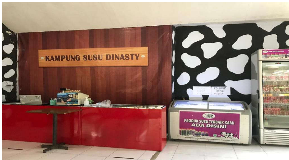
Gambar 4.1 Tempat penerimaan order di kantor layanan Kampung Susu Dynasty. 88

Seperti yang dikatakan pemilik Kampung Susu Dynasty, beliau menjelaskan tentang strategi bauran pemasaran, pentingnya sebuah perusahaan memiliki strategi pemasaran utamanya pada produk yang dijual.