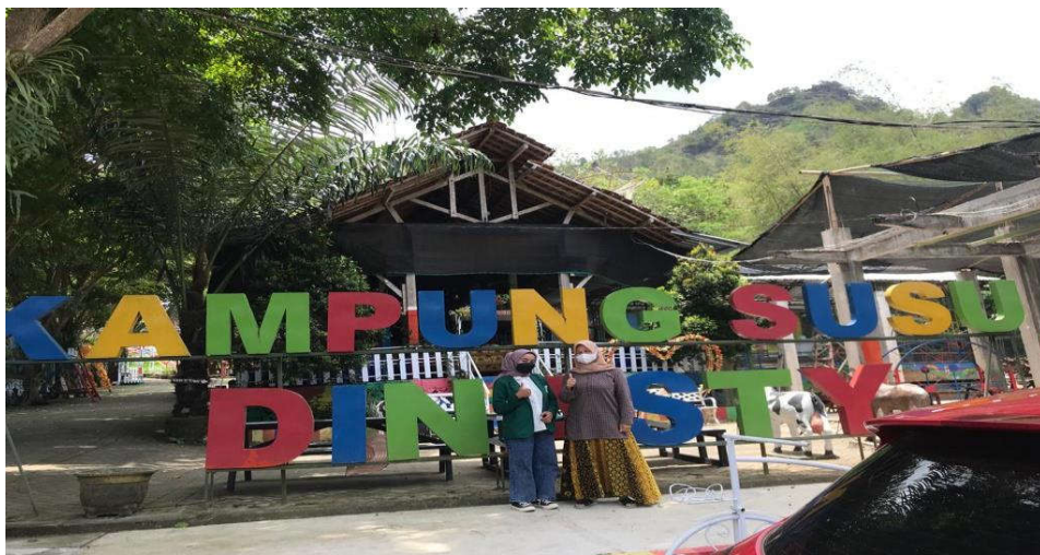
Gambar 4.2 Owner atau pemilik Kampung Susu Dinasty. 91

Hal ini diperkuat dengan hasil observasi penelitian yang dilaksanakan, yang mana pihak Kampung Susu Dinasty memasang sejumlah banner, papan reklame, dan alat sejenis di sekitaran lokasi objek wisata atau di seputar jalan protokol nasional yang dekat dengan lokasi. Hal ini menandakan meskipun Kampung Susu Dinasty telah dikenal luas masyarakat dan telah eksis, namun tetap saja memperkenalkan diri merupakan sebuah hal yang penting untuk dilaksanakan. 90