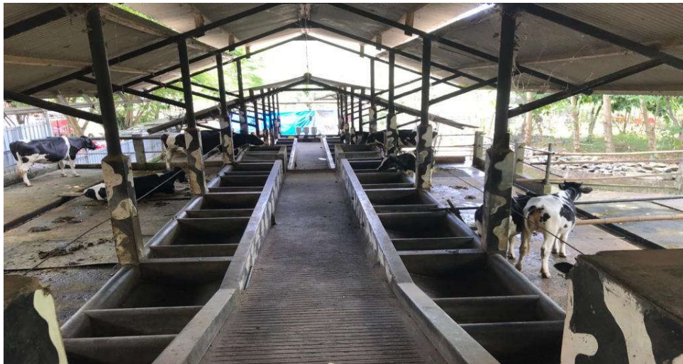
Gambar 4.4 sarana pengembangan produk susu di Kampung Susu Dinasty. 103

Pemerintah desa juga mendukung ide kami Kampung Susu Dinasty melalui kemudahan dalam perijinan dan lain-lainnya yang berhubungan dengan administrasi. Ini menjadi sebuah kemudahan yang diberikan oleh pihak Desa dalam memberikan dukungan nyata kepada Kampung Susu Dinasty. 102