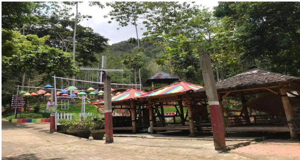
Gambar 4.5 Kondisi Kampung Susu Dinasty sepi di masa pandemi Covid-19. 107

Selama pandemi ini kita kan juga hampir selalu tutup seiring kebijakan pemerintah jadi kita fokus di penjualan produk Kampung Susu Dinasty. Kalau wisata hampir mati, atau memang ada penutupan yang dilakukan oleh pemerintah seiring dengan pembatasan yang dilaksanakan. 106