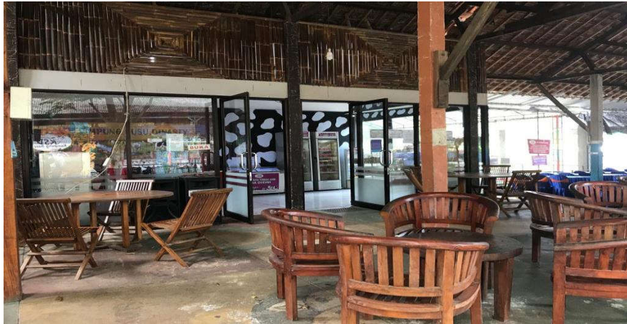
Gambar 4.7 Kondisi Kampung Susu Dynasty sepi di masa pandemi Covid-19. 120

Selain itu, hambatan yang sering terjadi dalam penjualan di medsos adalah dibatalkan. Terkadang pembatalan terjadi ketika proses negosiasi telah berakhir, ini juga menjadi persoalan yang sering terjadi pada penjualan secara online di Kampung Susu Dynasty.