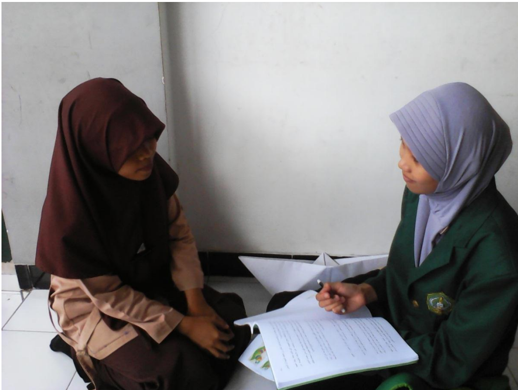
المقابلة مع بنتا كطالبة معهد دار الحكمة ١٦ ابريل ٢٠١٥