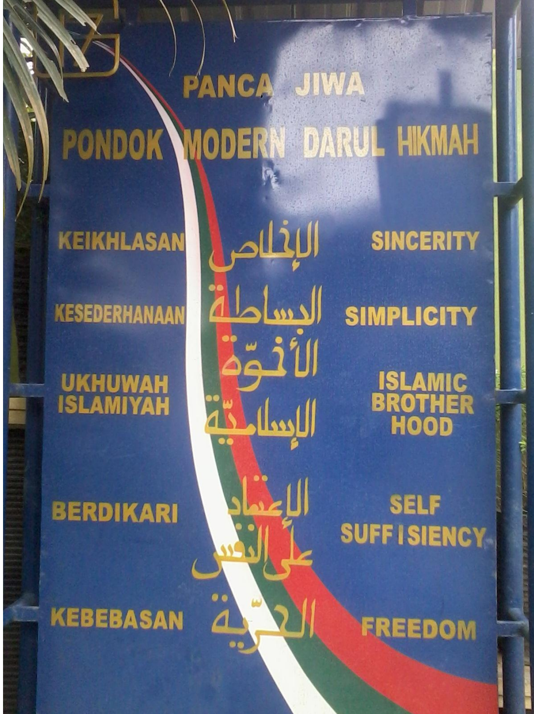
شعار المعهد "دار الحكمة"