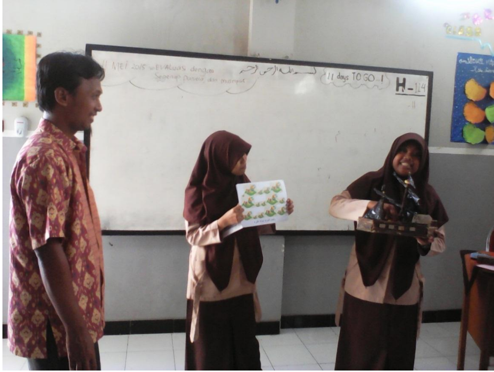
معاملة التعليم للطلاب في الدرس المطالعة ١٦ ابريل ٢٠١٥