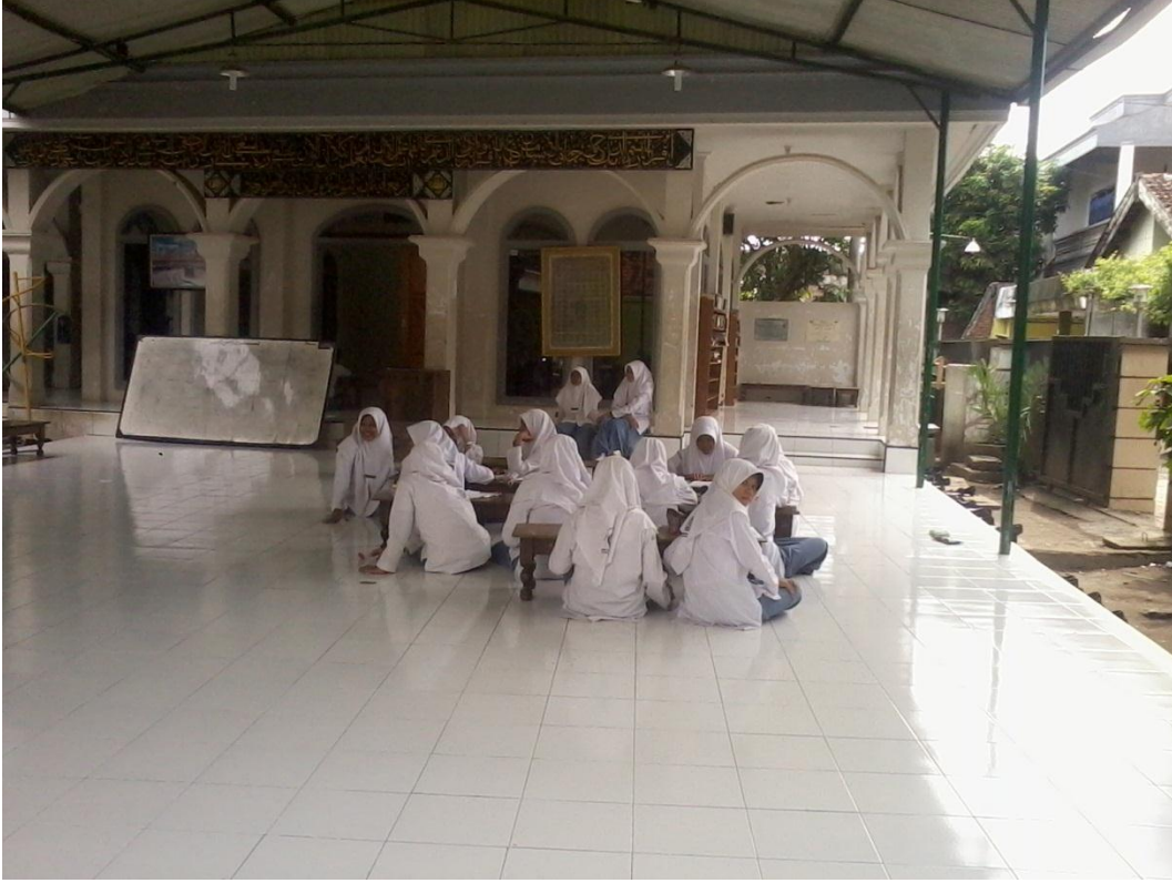
معاملة التعليم للجمع الطلاب في مسجد الرحمن