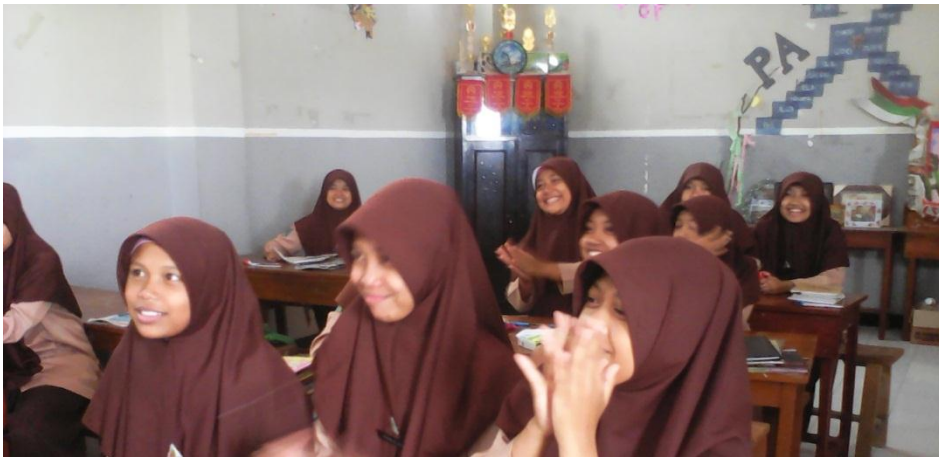
معاملة التعليم اليومية للطلبة في معهد دار الحكمة