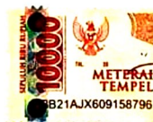
NATASYA AULIA RACHMAWATI Namaterangantandatangan

Tulungagung, 3 Januari 2022 Yang Menyatakan,